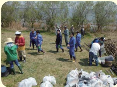
河川環境美化活動