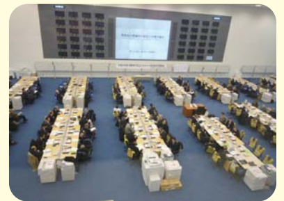
防災エキスパート講習会