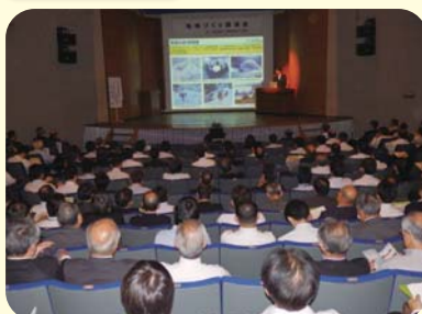
地域づくり講演会