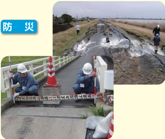
東日本大震災の被災状況調査