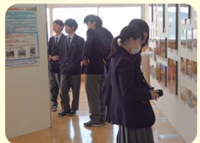
道のある風景写真コンクール学校展示会