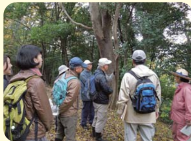
自然環境保全のための現地指導