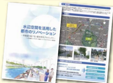
外濠再生に資する調査研究