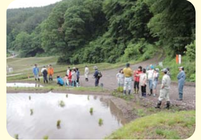
里山での棚田再生