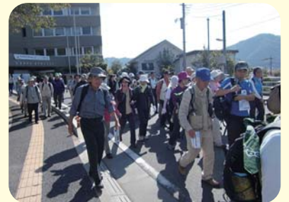
甲州街道を歴史に触れながらのウォーク